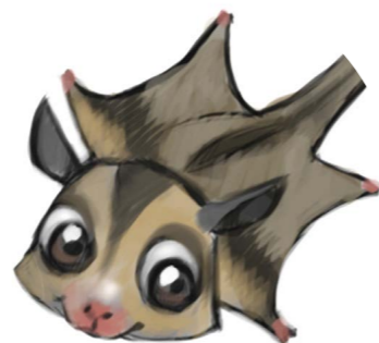
Magic Lights @Rainbow CGI