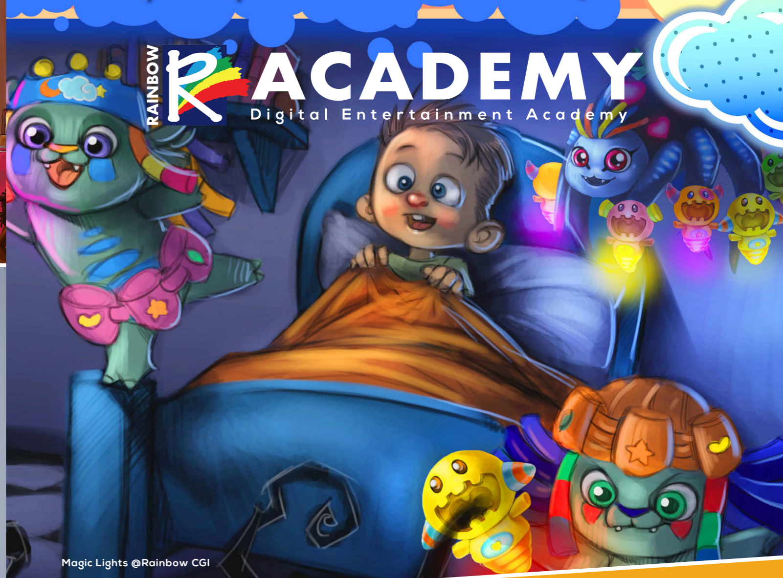
Magic Lights @Rainbow CGI