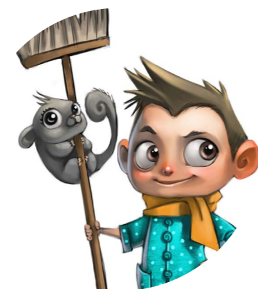
Magic Lights @Rainbow CGI