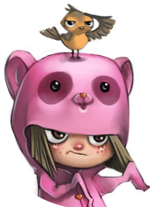
Magic Lights @Rainbow CGI