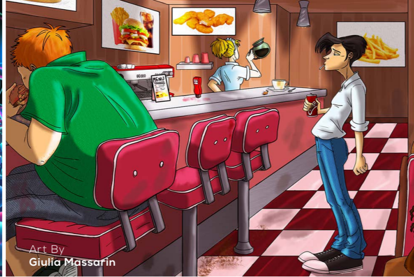
Art By Giulia Massarin