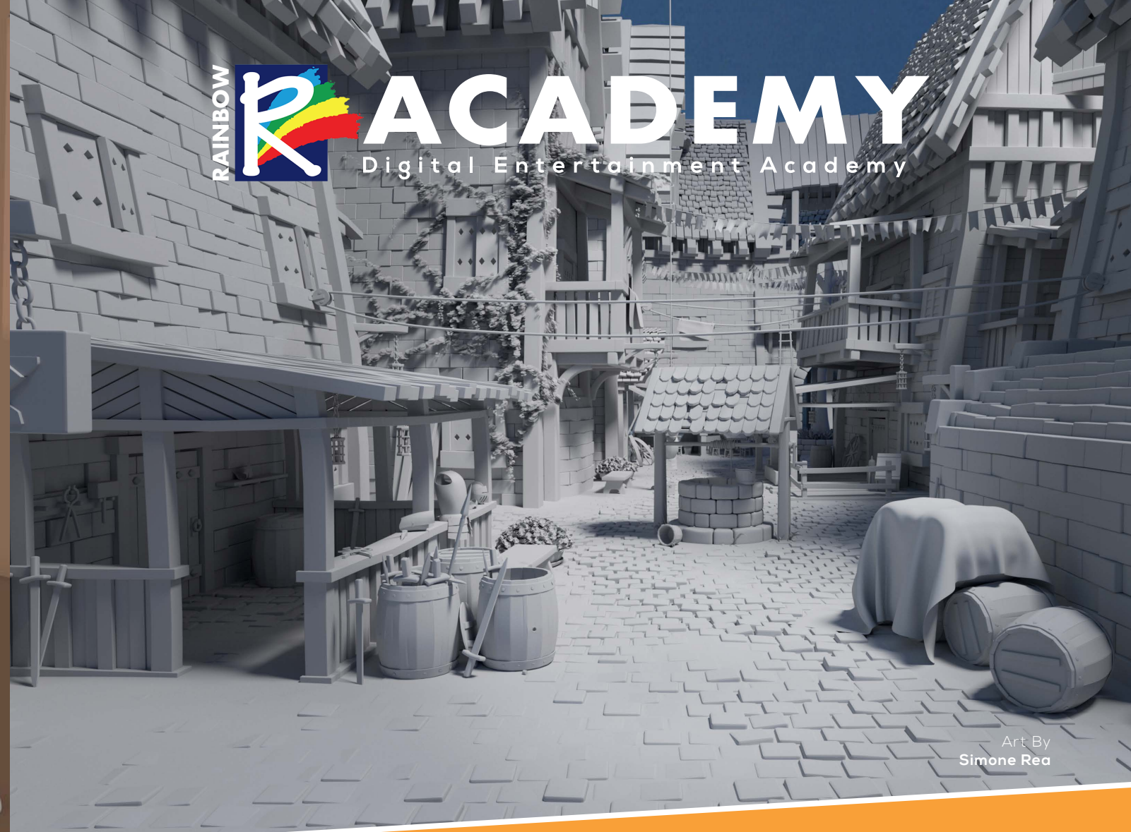
Art By Simone Rea