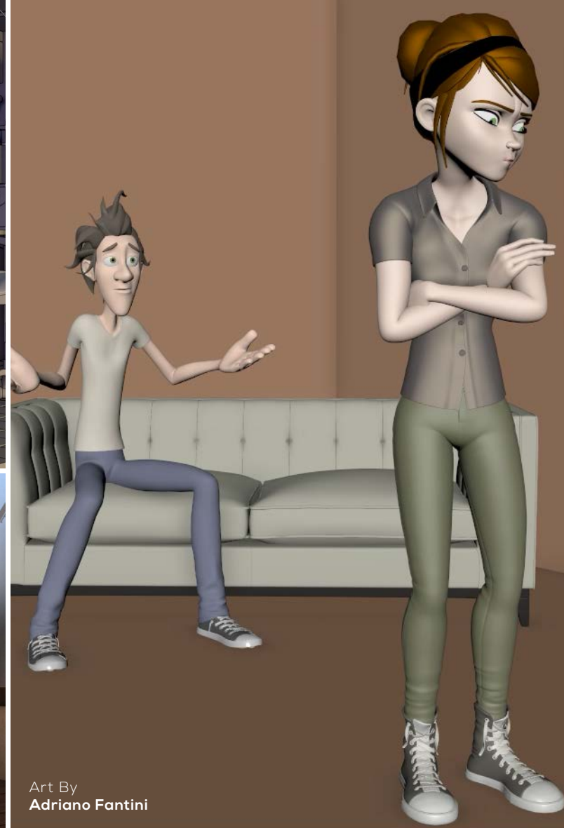
Art By Adriano Fantini