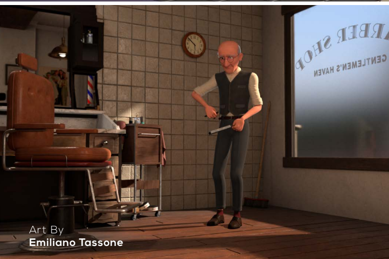
Art By Emiliano Tassone