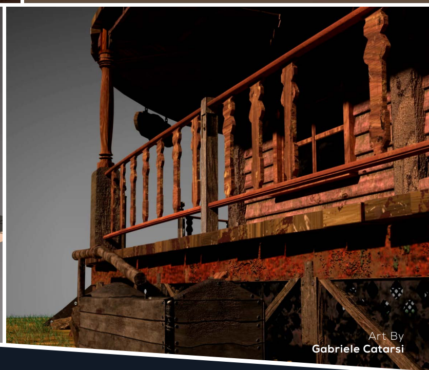
Art By Gabriele Catarsi