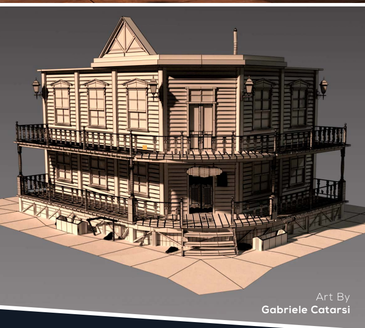
Art By Gabriele Catarsi